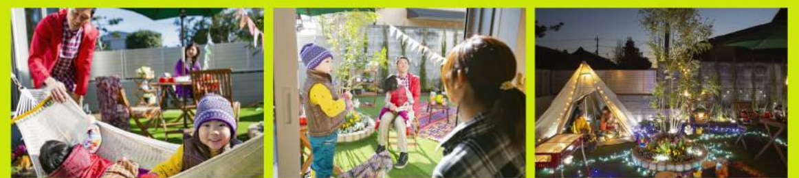
掲載の写真は、ナイスパワーホーム上中居 陽だまりの街No.4モデルハウスの写真です。

【ナイスパワーホーム上中居 陽だまりの街 全体物件概要】●所在地/群馬県高崎市上中居町138-4他 ●交通/JR上越線「高崎」駅徒歩18分 ●建ぺい率/60% (No.7は70%) ●容積率/200% ●地目/宅地 ●用途地域・地区/第一種住居地域 ●総区画数/11区画 ●道路幅員/約6.0m (街区内開発道路・公道) ※お引渡しまでに高崎市に帰属予定 ●私道負担/無し ●開発総面積/2,305㎡ ●開発許可番号/第289号 (平成29年12月1日) ●設備/電気 (東京電力エナジーパートナー株式会社他、お客様のご希望により選択いただけます)、都市ガス (東京ガス他、お客様のご希望により選択いただけます)、水道 (市営)、下水 (公共) ●手付金等の保全機関/全国不動産信用保証株式会社 ●売主/ナイス株式会社/神奈川県横浜市鶴見区鶴見中央4-33-1 ●宅地建物取引業免許/国土交通大臣 (3) 第7535号 ●建設業許可番号/国土交通大臣許可 (特-27) 第26132号 (般-29) 第26132号、所属団体名/(一社) 不動産流通経営協会会員、(一社) 不動産協会会員、(公社) 首都圏不動産公正取引協議会加盟 【新築戸建て分譲物件概要】 ●販売棟数/7棟 ●分譲価格 (税込)/3,780万円~4,580万円 ●土地面積/153.88㎡ (約46.55坪) ~179.45㎡ (約54.28坪) ●建物面積/96.88㎡ (約29.31坪) ~103.09㎡ (約31.18坪) ●間取り/1LDK (別途有償にて2LDK~5LDKに間仕切り変更可能)、2LDK ●構造・規模/木造2階建て専用住宅、屋根 (スレート瓦葺)、外壁 (防火サイディング) ●建物完成時期/No7 (平成30年9月) No2, 4, 5, 6, 10, 11 (平成31年2月下旬予定) ●入居時期/平成31年3月下旬 ●建築確認番号/第H30群建技建築00219号 (平成30年5月25日) 他 【建築条件付宅地分譲 物件概要】 ●販売区画数/3区画 ●土地価格/2,250万円~2,510万円 ●土地面積/153.03㎡ (約46.29坪) ~168.70㎡ (約51.03坪) ●備考 ※建築条件付宅地分譲とは、土地売買契約締結後3ヶ月以内に当社との住宅の建築請負契約を締結していただくことを条件とし、この期間内に当社との住宅の建築請負契約が成立しなかった場合には、土地売買契約は白紙契約となり、前受金等はすみやかに返還する制度です。●広告有効期限/平成31年2月24日 ※先着順受付中につき販売済となる場合があります。予めご了承ください。