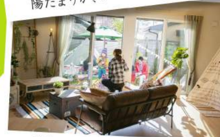
リビングの陽だまりも嬉しい!