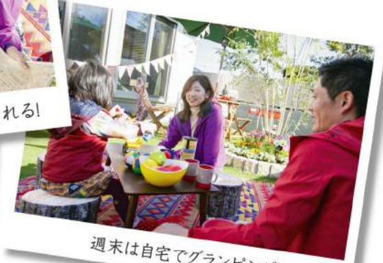
週末は自宅でグランピング!

※掲載の写真は、ナイスパワーホーム上中居 陽だまりの街No.4モデルハウスの写真です。