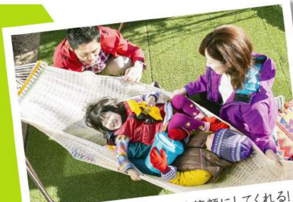
陽だまりが、いつも家族を笑顔にしてくれる!

ナイスパワーホーム上中居 陽だまりの街 区画No.4 陽だまりを愉しむ コンセプトモデルハウス